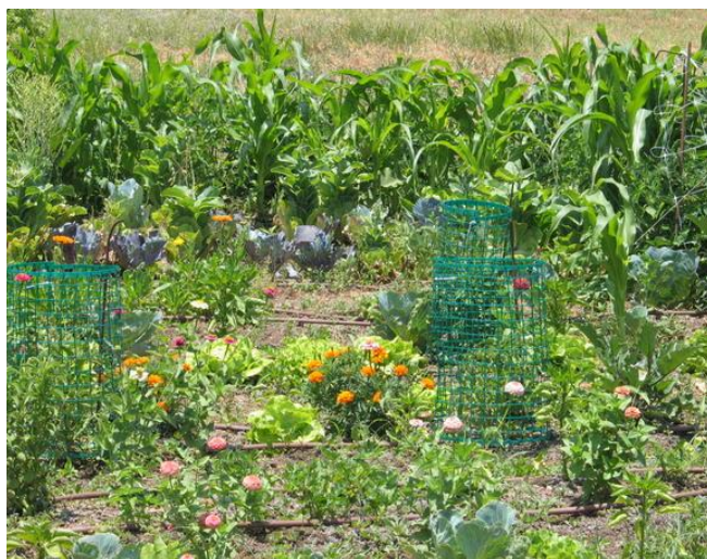
מקום מפגש בשדה החסה

שבתות וחגים 8:00-16:00 שישי וערבי חג 8:00-14:00 האתר של פארק רמת הנדיב