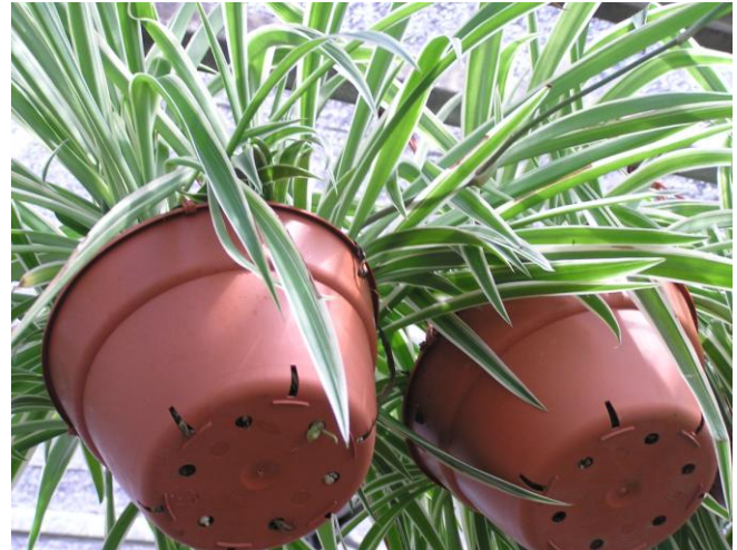
ישרדו את החופשה???